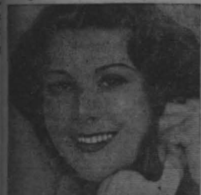
Frances Dee, en "Dinero Sangriento" (20th Century-United Artists)